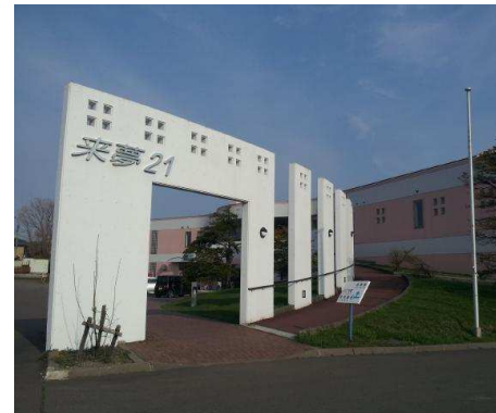
複合文化施設来夢21 徒歩8分