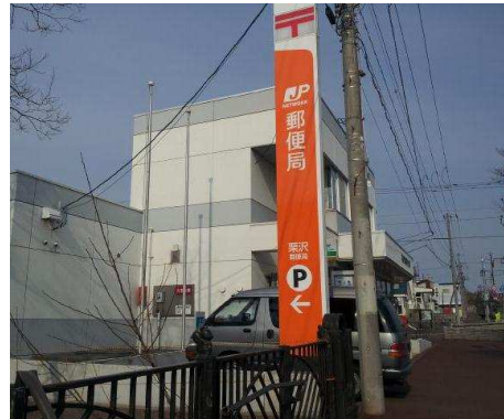
栗沢郵便局 徒歩1分