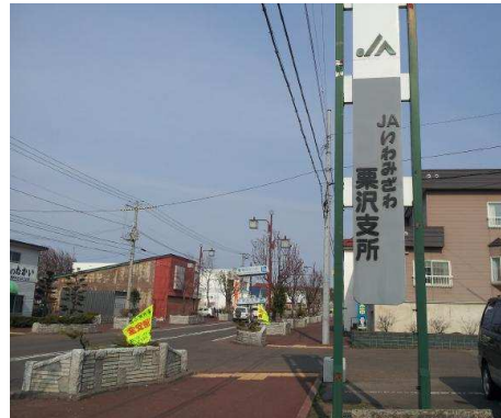
岩見沢農協 栗沢支所 徒歩1分