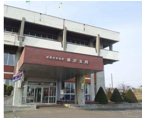
岩見沢市役所栗沢支所 徒歩4分