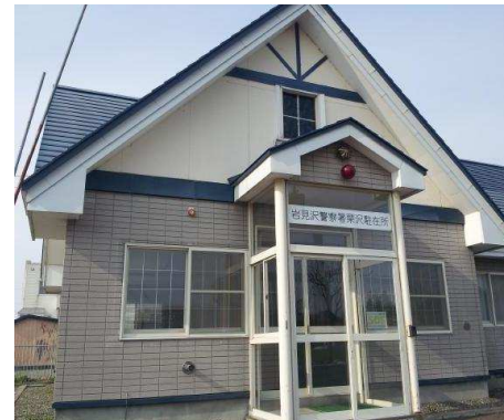
岩見沢警察署栗沢駐在所 徒歩1分