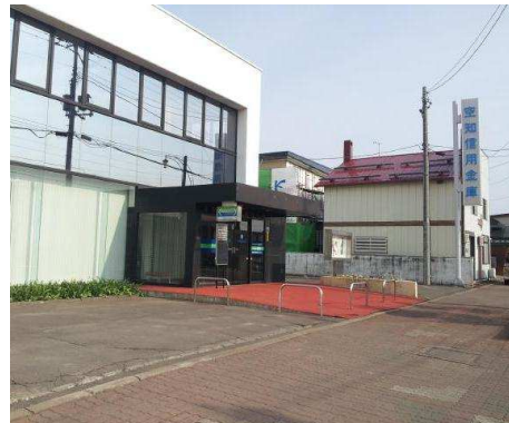
空知信用金庫 徒歩3分