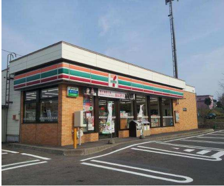
セブンイレブン栗沢町店 徒歩4分