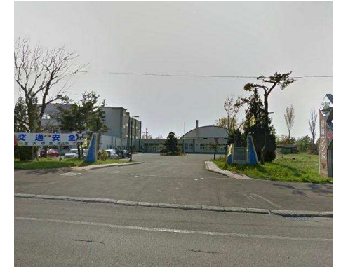
栗沢中学校 徒歩10分