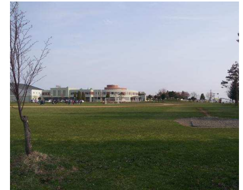
栗沢小学校 徒歩9分