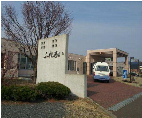
栗沢病院／福祉センター 徒歩6分